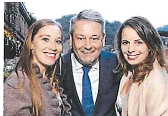
Gipfel der Ski-Königinnen: Michaela Dorfmeister & Alexandra Meissnitzer